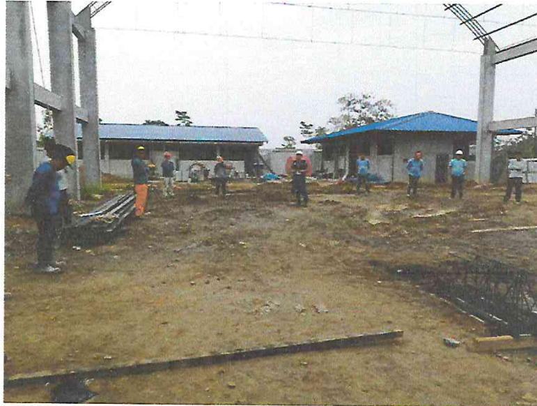
FOTO N°01: Vista de la charla de seguridad en la obra "Mejoramiento y Equipamiento del servicio Educativo N° 62200 Barrio Carabanchel - San Lorenzo, Distrito Barranca, Provincia Datem Del Marañón - Loreto"