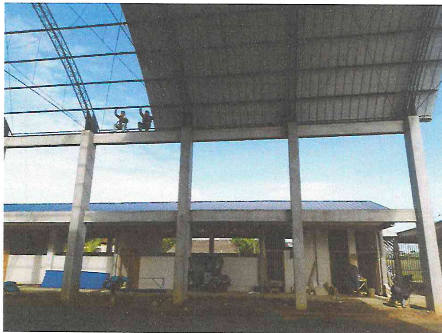
FOTO N°13: Vista del avance del techado de la losa deportiva en la obra "Mejoramiento y Equipamiento del servicio Educativo N° 62200 Barrio Carabanchel - San Lorenzo, Distrito Barranca, Provincia Datem Del Marañón - Loreto".