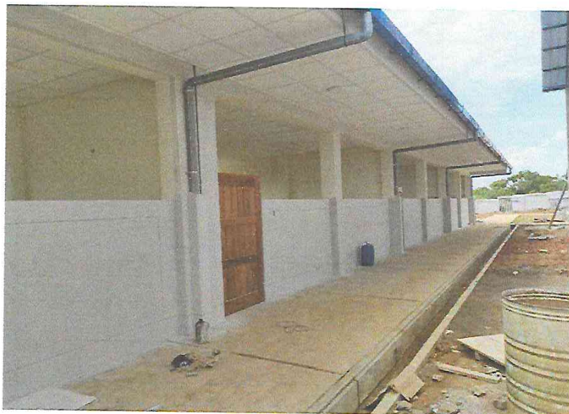
FOTO N°03: Vista de modulo principal, montaje de montantes pluviales y limpieza del pabellón en la obra "Mejoramiento y Equipamiento del servicio Educativo N° 62200 Barrio Carabanchel - San Lorenzo, Distrito Barranca, Provincia Datem Del Marañón - Loreto".