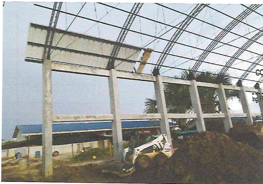
FOTO N°12: Vista del techado de la losa deportiva en la obra "Mejoramiento y Equipamiento del servicio Educativo N° 62200 Barrio Carabanchel - San Lorenzo, Distrito Barranca. Provincia Datem Del Marañón - Loreto".