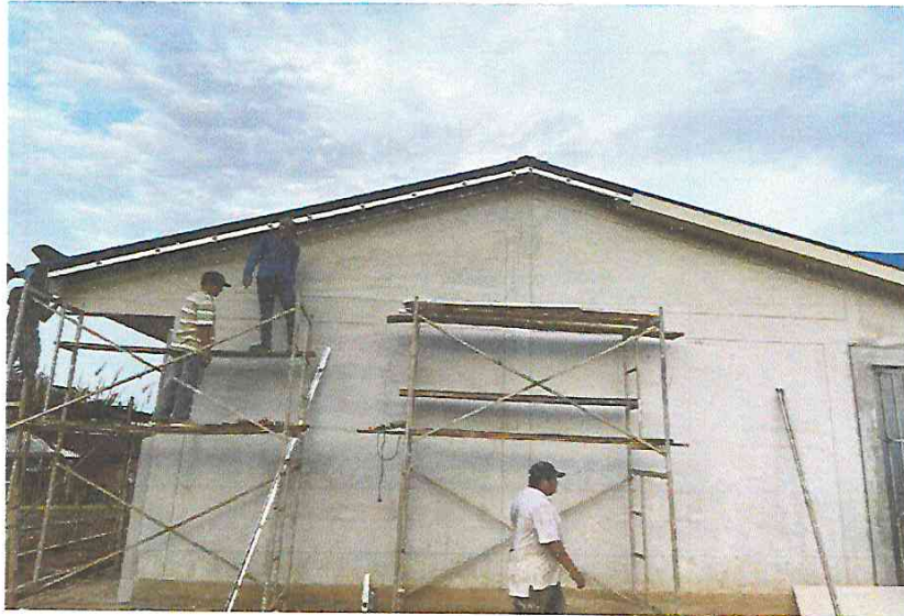
FOTO N° 05: Vista del colocado de cielo raso en exterior de módulos en la obra "Mejoramiento y Equipamiento del servicio Educativo N° 62200 Barrio Carabanchel - San Lorenzo, Distrito Barranca, Provincia Datem Del Marañón - Loreto".