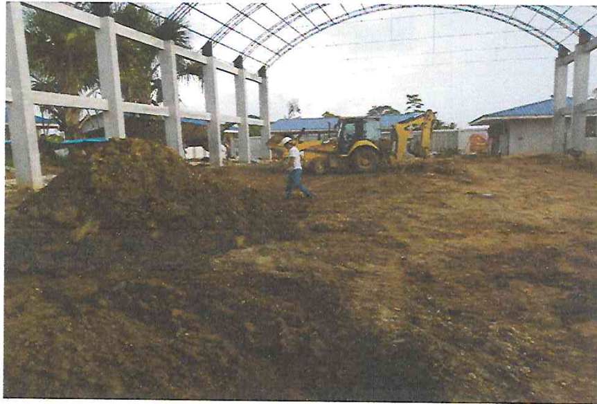
FOTO N°11: Vista del nivelado de terreno para losa deportiva en la obra "Mejoramiento y Equipamiento del servicio Educativo N° 62200 Barrio Carabanchel - San Lorenzo, Distrito Barranca. Provincia Datem Del Marañón - Loreto".