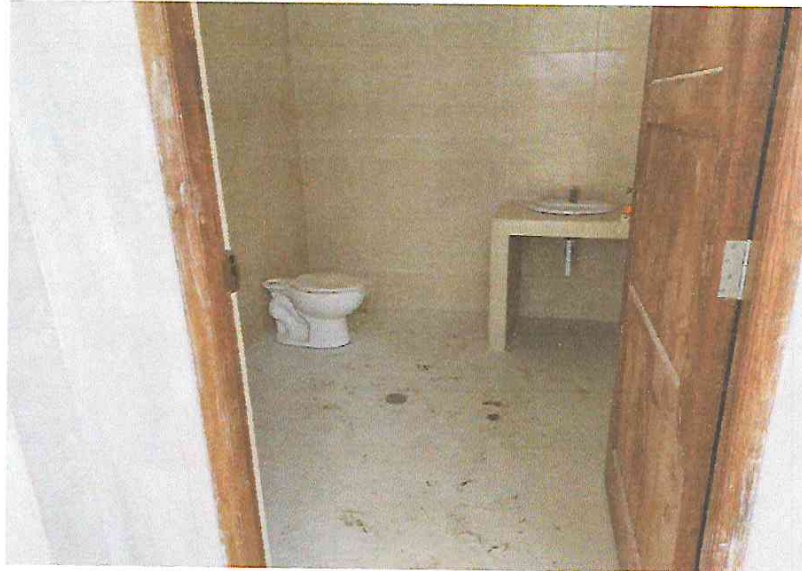
FOTO N°09: Vista aparatos sanitarios instalados en los SS. HH "Mejoramiento y Equipamiento del servicio Educativo N° 62200 Barrio Carabanchel - San Lorenzo, Distrito Barranca, Provincia Datem Del Marañón - Loreto".