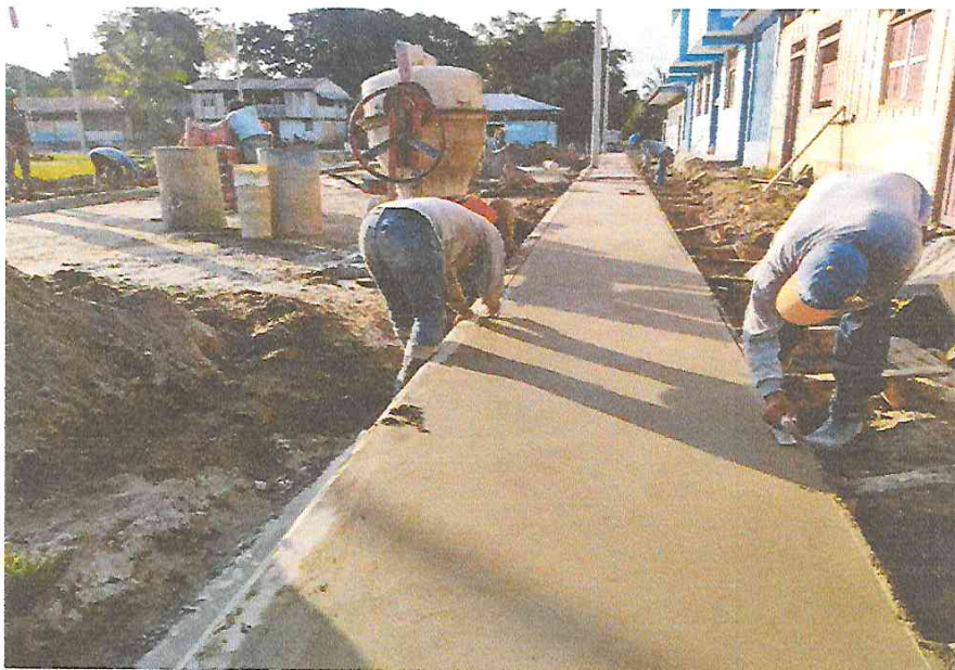
- LLENADO DE VEREDA E=0.10 M, MORTERO F'C=175 KG/CM2