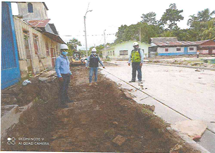
- LIMPIEZA, CONFORMACION, NIVELACION Y COMPACTACION PARA LOS TRABAJOS DE VEREDAS.