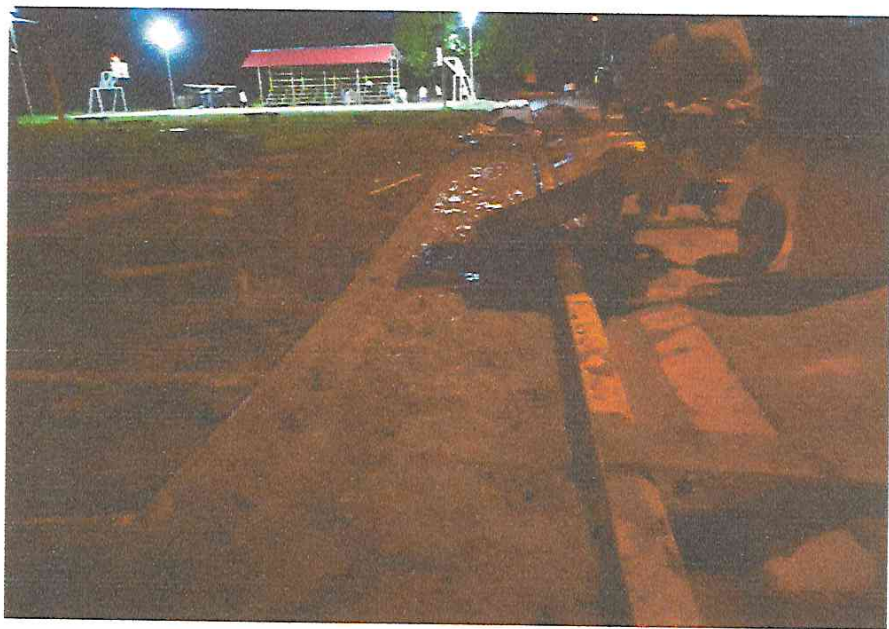
- LLENADO DE SOLADO E=2" PARA VEREDAS