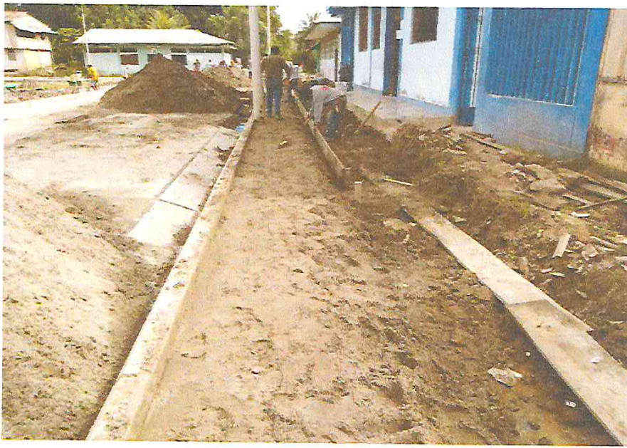
- COLOCACION DE CAMA DE ARENA ANTICONTAMINANTE PARA VEREDAS E=0.10 M