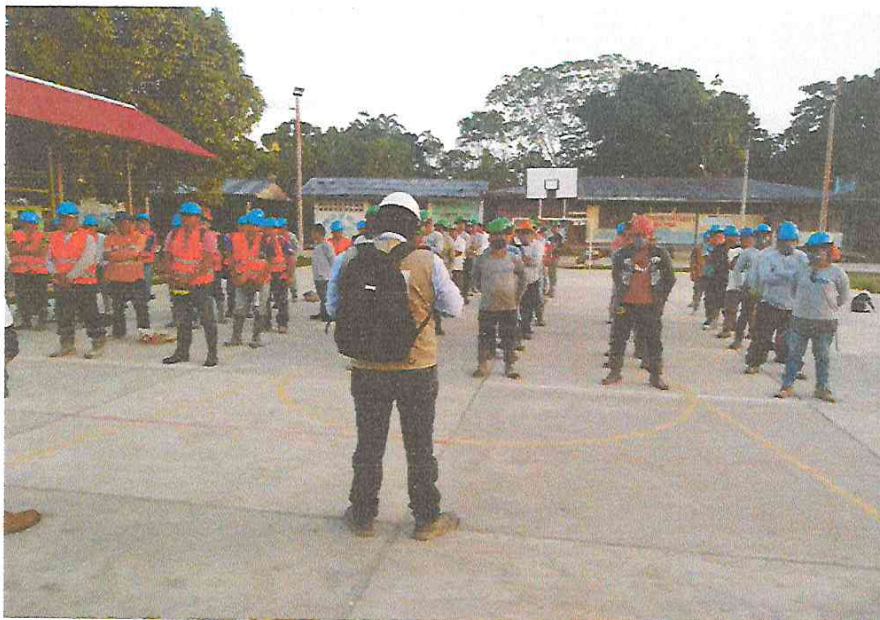
- CHARLA TECNICA SOBRE LOS TRABAJOS QUE SE EJECUTARAN DURANTE EL DIA.