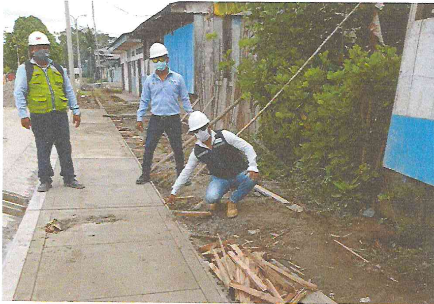
- DETALLE EN VEREDAS COMO SU ACABADO, VERIFICACION Y APROBACION CON SUPERVISION IN SITU DEL MISMO.