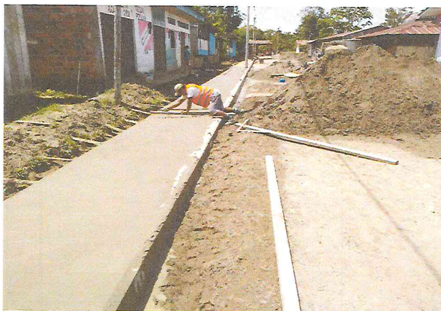
- ACABADO CON BRUÑA DE CANTO Y TRANSVERSAL EN VEREDAS.