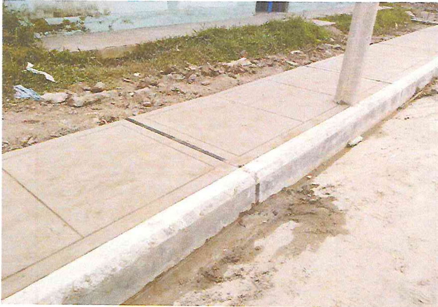
- JUNTA DE DILATACION EN VEREDA CON MEZCLA DE ASFALTO Y ARENA CADA 3 M.