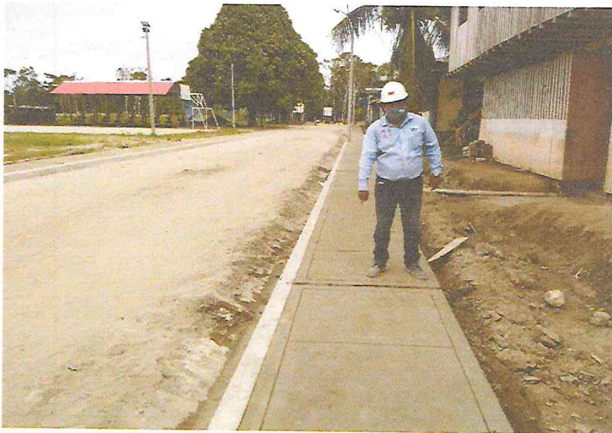
- VERIFICACION DE LA JUNTA DE DILATACION EN VEREDA CON MEZCLA DE ASFALTO Y ARENA CADA 3 M ASI COMO TAMBIEN LAS BRUÑAS DE CANTO Y TRANSVERSAL EN VEREDAS.