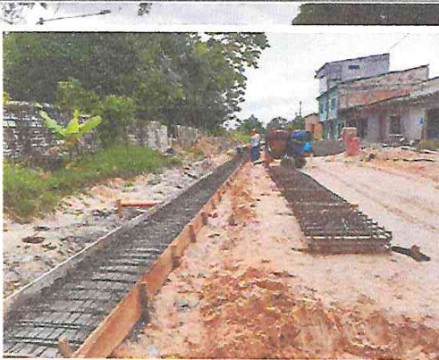
Vista: Vaceo de losa superior de canal en Ca. Libertad (Ca. Vargas Guerra / Pje. Sesquicentenario)