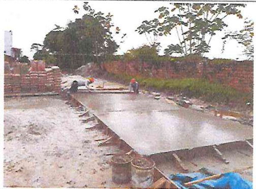
Vista: Vaceo de losa de rodadura en Ca. Libertad (Pje. Independencia / Ca. Vargas Guerra)