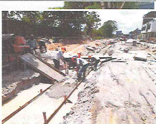
Vista: Vaceo de solado para canal en calle Libertad (Pje. Atlántida/Pje. Independencia)