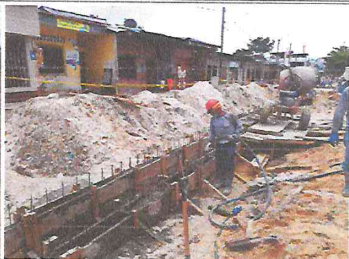
Vista: Vaceo de muro lateral en Pje. Atlántida (Ca. Libertad / Ca. Atahualpa)