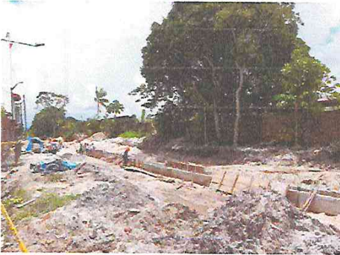
Vista: Desencofrado de muro de canal en Ca. Libertad (Pje. Independencia / Pje. Atlántida)