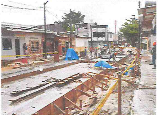
Vista: Encofrado y vaceo de losa de rodadura en Pje. Atlántida (Ca. Libertad / Ca. Atahualpa)