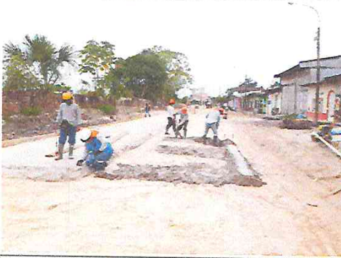
Vista: Vaceo de solado en Ca. Libertad (Pje. Independencia / Ca. Vargas Guerra)