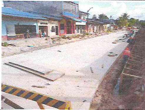
Vista: Encofrado de sardinel y cuneta en Ca. San Roman (Ca. Atahualpa/Jr. Jose Galvez)