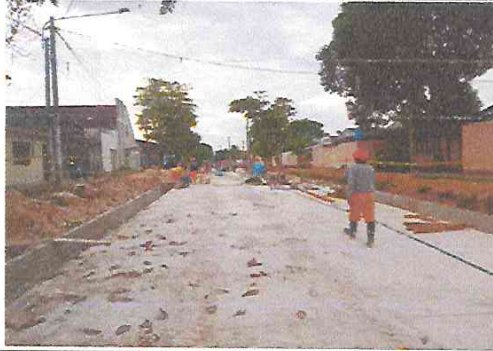
Vista: Encofrado de sardinel y cuneta en Ca. Libertad (Ca. castilla/Ca. San roman)