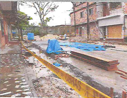
Vista: Solado para losa de rodadura en Pje. Atlántida (Ca. Libertad / Ca. Atahualpa)