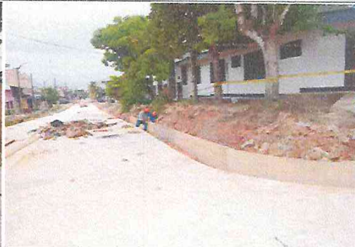
Vista: Encofrado de sardinel y cuneta en Ca. San roman con Ca. Libertad