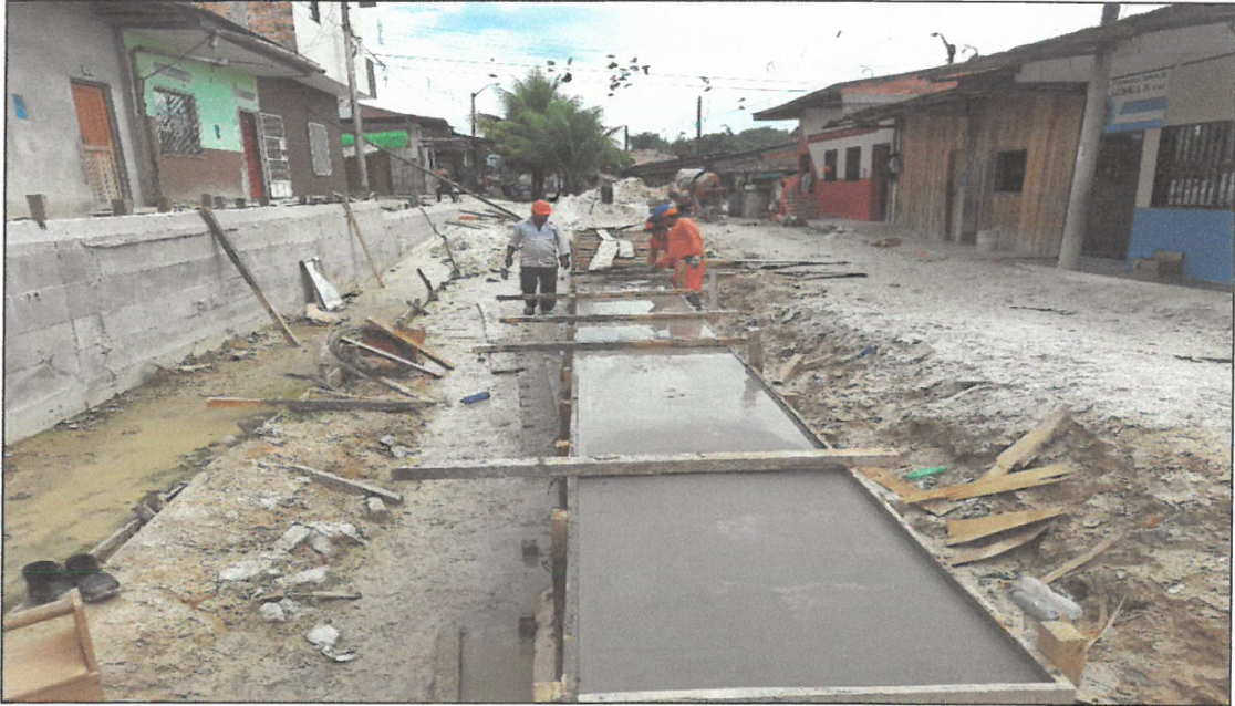
VISTA FOTOGRÁFICA N° 02 : ACERO CORRUGADO 1/2" EN CANAL DE ALCANTARILLADO EN CALLE SALAVERRY.