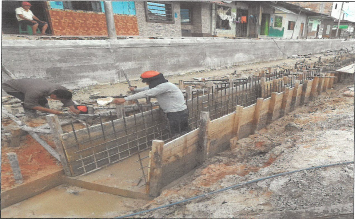
VISTA FOTOGRÁFICA N° 04: VACEADO DE LOSA DE RODADURA EN CALLE LAGUNAS TRAMO III.