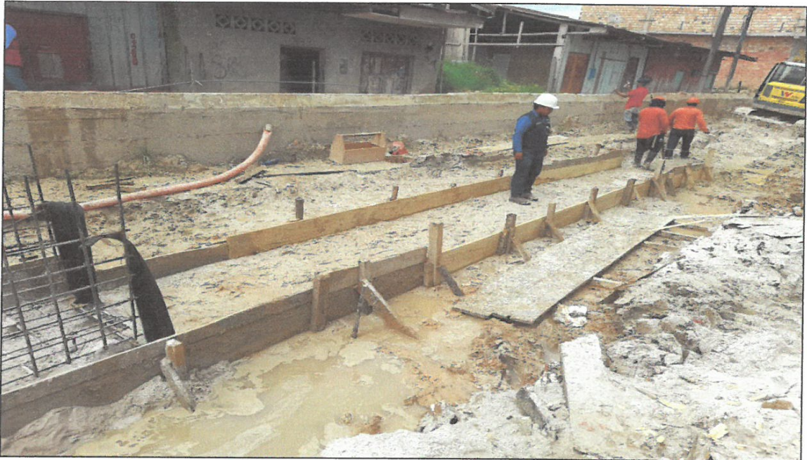
VISTA FOTOGRÁFICA N° 06: ACERO CORRUGADO 1/2" EN CANAL DE ALCANTARILLADO EN CALLE SALAVERRY.