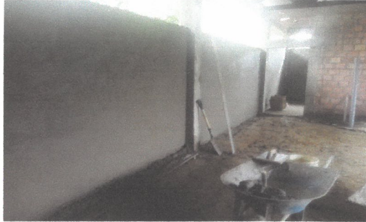
VISTA N° 01

En esta toma se muestra el tarrajeo de los muros vigas y columnas