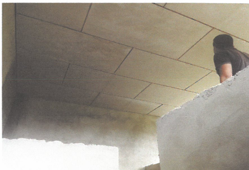
VISTA N° 04

En esta toma se muestra la culminación del empotrado de los tubos que servirán de bajada de agua pluvial y el término del tarrajeo de la obra.