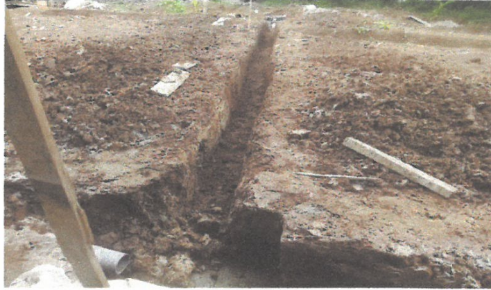
VISTA N° 07

En esta toma se muestra el excavado de la zanja de percolación del biodigestor y colocados de los tubos de 4"