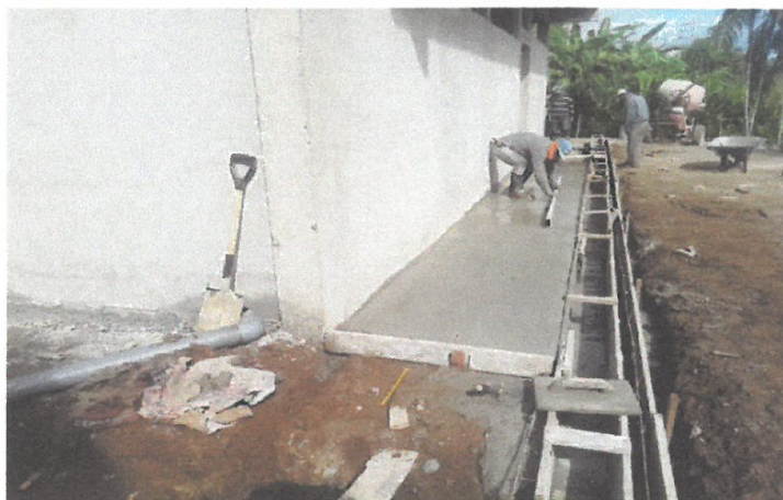
VISTA N° 06

En esta toma se muestra los bruñados en columnas y vigas en la obra