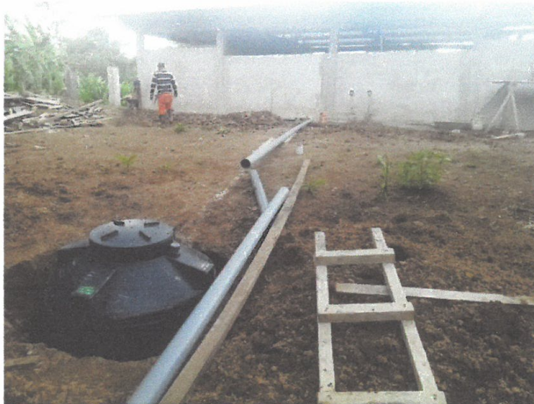
VISTA N° 08

En esta toma se muestra el excavado de la zanja de percolación del biodigestor y colocados de los tubos de 4"