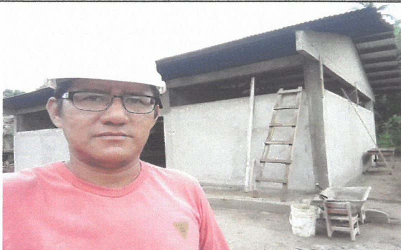
VISTA N° 03

En esta toma se muestra la culminación del empotrado de los tubos que servirán de bajada de agua pluvial y el término del tarrajeo de la obra.