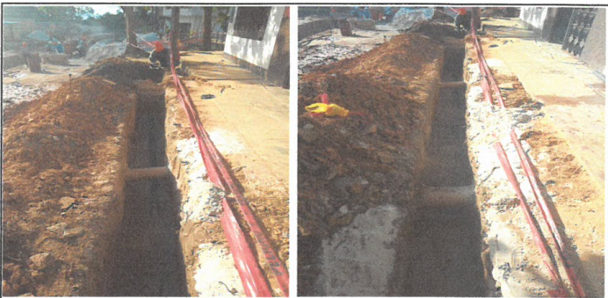
RELLENO MANUAL APISONADO EN ZANJAS PARA TUBERIA DE AGUA POTABLE 90mm

Código SNP: 341522 Nombre del Proyecto: "MEJORAMIENTO DE LA CALLE LIBERTAD (IKAMU JK. CASTILLA/CA. GARCILAZO), CA. SAN ROMAN, CA. ATLANTIDA, PSJE. INDEPENDENCIA, PSJE. SECUCIENTENARIO, CALLE PALMERAS Y PSJE. 23 DE SEPTIEMBRE, DISTRITO DE JIJITOS, PROVINCIA DE MAYAGÜES, LORETO"