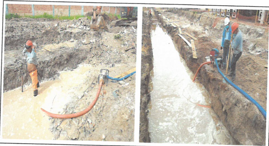
BOMBEO PARA ELIMINACION DE AGUAS FILTRANTES Y PLUVIALES