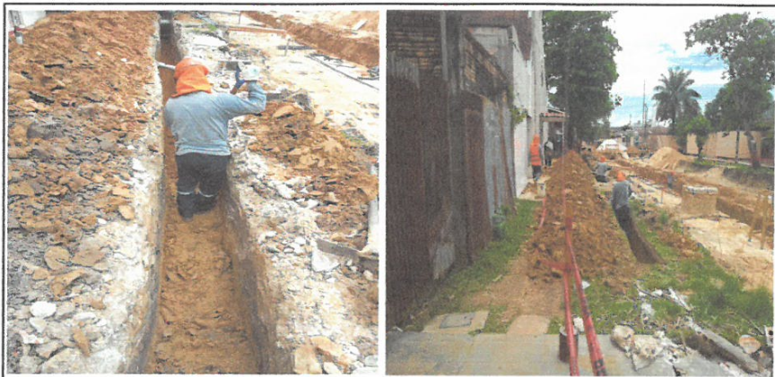
REFINE Y NIVELACION DE ZANJA PARA TUBERIA DE AGUA DE 90mm Y CONEXION

Código SNP: 341522 Nombre del Proyecto: "MEJORAMIENTO DE LA CALLE LIBERTAD (IKAMU JK. CASTILLA/CA. GARCILAZO), CA. SAN ROMAN, CA. ATLANTIDA, PSJE. INDEPENDENCIA, PSJE. SECUCIENTENARIO, CALLE PALMERAS Y PSJE. 23 DE SEPTIEMBRE, DISTRITO DE JIJITOS, PROVINCIA DE MAYAGÜES, LORETO"