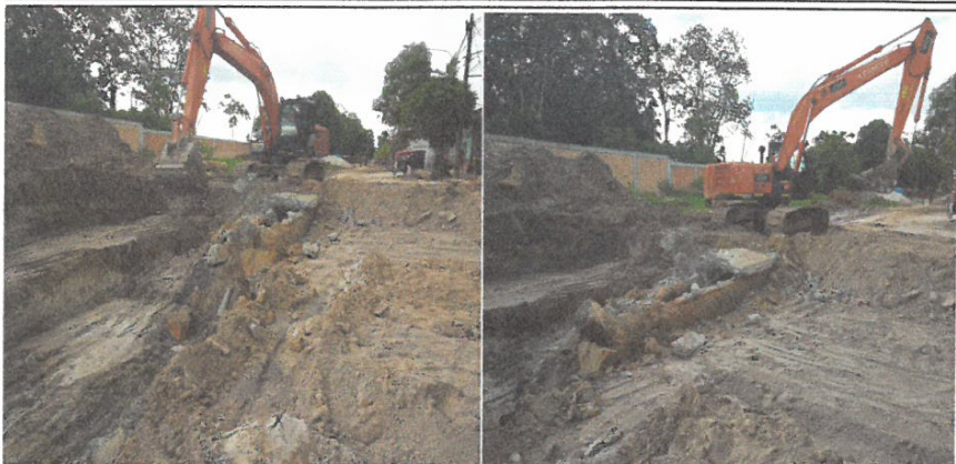
DEMOLICION DE GAMBOTA Y CANAL EXISTENTE DE MORTERO ARMADO

Nombre del Proyecto: "MEJORAMIENTO DE LA CALLE LIBERTAD (TRAMO JR. CASTILLA/CA. GARCILAZO), CA. SAN ROMÁN, CA. ATLANTIDA, PSJE. INDEPENDENCIA, PSJE. SESQUICENTENARIO, CALLE PALMERAS Y PSJE. 22 DE SETIEMBRE, DISTRITO DE IQUITOS, PROVINCIA DE MAYNAS - LORETO".