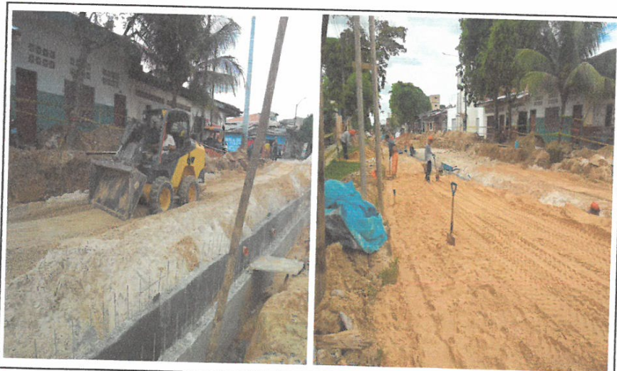
RELLENO DE SOBRE EXCAVACION DEBAJO DE SUB RASANTE, CON MATERIAL DE PRESTAMO

Nombre del Proyecto: "MEJORAMIENTO DE LA CALLE LIBERTAD (TRAMO JR. CASTILLA/CA. GARCILAZO), CA. SAN ROMÁN, CA. ATLANTIDA, PSJE. INDEPENDENCIA, PSJE. SESQUICENTENARIO, CALLE PALMERAS Y PSJE. 22 DE SETIEMBRE, DISTRITO DE IQUITOS, PROVINCIA DE MAYNAS - LORETO".