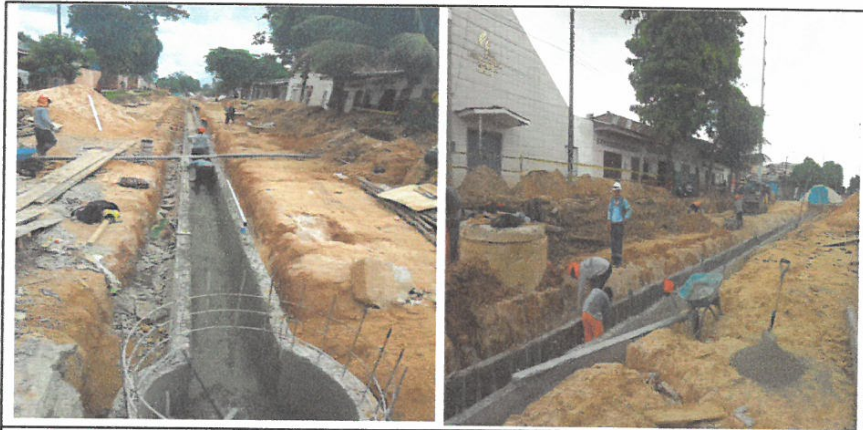
ENLUCIDO PULIDO EN CANAL CON MORTERO 1:5

Nombre del proyecto: "MEJORAMIENTO DE LA CALLE LIBERTAD (IKAMU JK. CASTILLA/CA. GARCILAZO), CA. SAN ROMAN, CA. ATLANTIDA, PSJE. INDEPENDENCIA, PSJE. SECUCENTENARIO, CALLE PALMERAS Y PSJE. 33 DE SEPTIEMBRE, DISTRITO DE JIJITOS, PROVINCIA DE MAYAGÜES, LORETO"