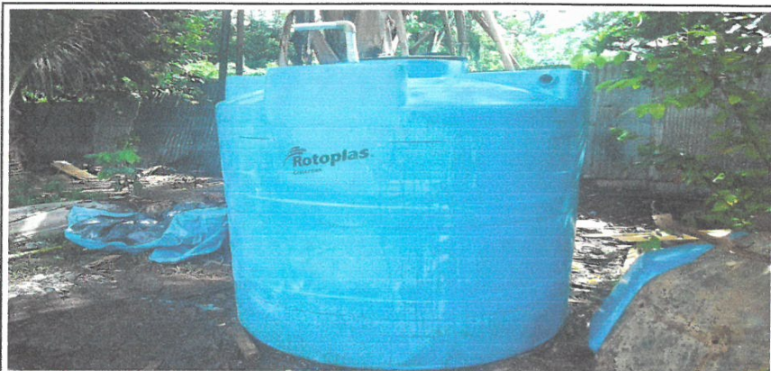
TANQUE DE ALMACENAMIENTO DE AGUA CON CAPACIDAD DE 2500 LT