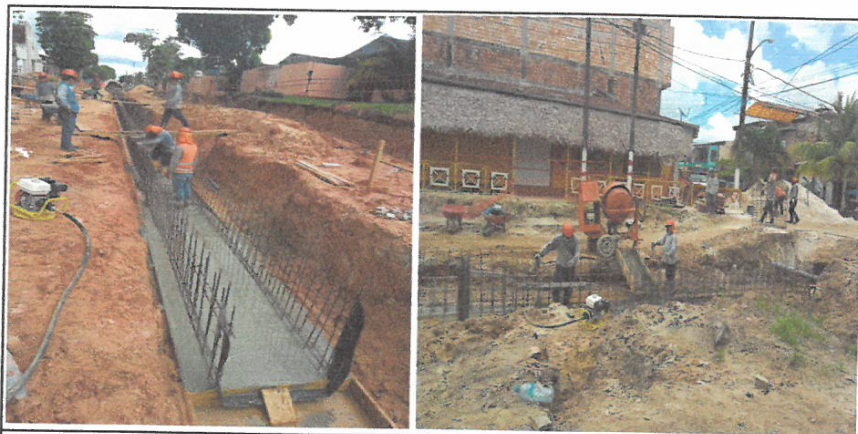
CONCRETO F'c=210 Kg/cm2 EN CANAL RECTANGULAR

Nombre del Proyecto: "MEJORAMIENTO DE LA CALLE LIBERTAD (TRAMO JR. CASTILLA/CA. GARCILAZO), CA. SAN ROMÁN, CA. ATLANTIDA, PSJE. INDEPENDENCIA, PSJE. SESQUICENTENARIO, CALLE PALMERAS Y PSJE. 22 DE SETIEMBRE, DISTRITO DE IQUITOS, PROVINCIA DE MAYNAS - LORETO"