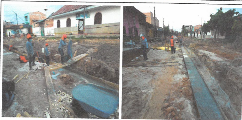
SOLADO MEZCLA CA 1:10 e=1:10 e=0.10 m. PARA CANAL RECTANGULAR

Nombre del Proyecto: "MEJORAMIENTO DE LA CALLE LIBERTAD (TRAMO JR. CASTILLA/CA. GARCILAZO), CA. SAN ROMÁN, CA. ATLANTIDA, PSJE. INDEPENDENCIA, PSJE. SESQUICENTENARIO, CALLE PALMERAS Y PSJE. 22 DE SETIEMBRE, DISTRITO DE IQUITOS, PROVINCIA DE MAYNAS - LORETO"