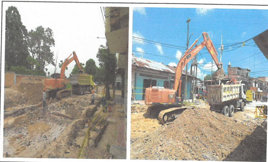
ELIMINACION DE MATERIAL EXCEDENTE A UNA DISTANCIA =3KM + 20% ESPONJAMIENTO