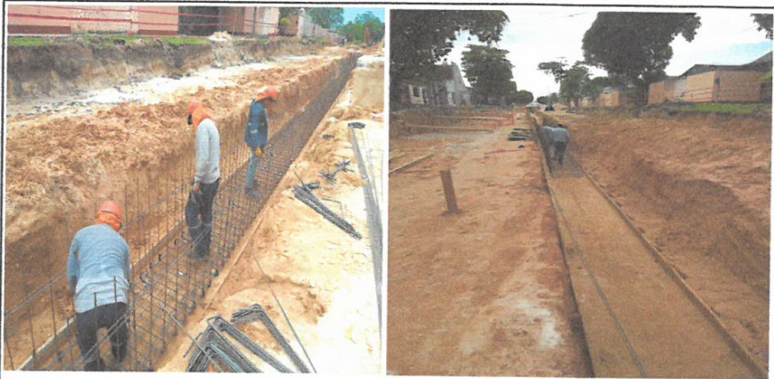
ACERO CORRUGADO 3/8" Fy=4200 Kg/m2 EN CANAL RECTANGULAR

Nombre del proyecto: "MEJORAMIENTO DE LA CALLE LIBERTAD (IKAMU JK. CASTILLA/CA. GARCILAZO), CA. SAN ROMAN, CA. ATLANTIDA, PSJE. INDEPENDENCIA, PSJE. SECUCENTENARIO, CALLE PALMERAS Y PSJE. 33 DE SEPTIEMBRE, DISTRITO DE JIJITOS, PROVINCIA DE MAYAGÜES, LORETO"