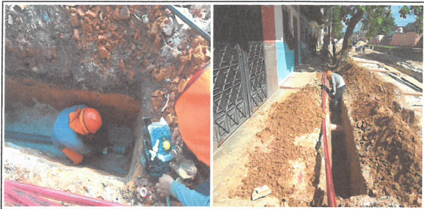
EXCAVACION MANUAL DE ZANJA PARA TUBERIA DE AGUA DE 90mm Y CONEXION

Código SNP: 341522 Nombre del Proyecto: "MEJORAMIENTO DE LA CALLE LIBERTAD (IKAMU JK. CASTILLA/CA. GARCILAZO), CA. SAN ROMAN, CA. ATLANTIDA, PSJE. INDEPENDENCIA, PSJE. SECUCIENTENARIO, CALLE PALMERAS Y PSJE. 23 DE SEPTIEMBRE, DISTRITO DE JIJITOS, PROVINCIA DE MAYAGÜES, LORETO"