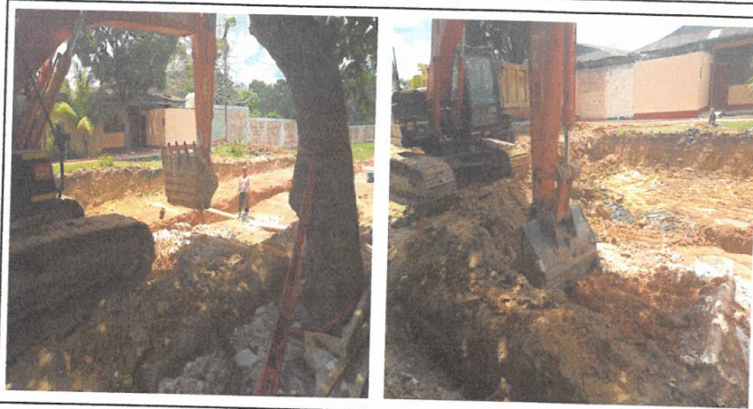
CORTE DE TERRENO A NIVEL DE SUB RASANTE CON TRACTOR D-6 140HP

Nombre del Proyecto: "MEJORAMIENTO DE LA CALLE LIBERTAD (TRAMO JR. CASTILLA/CA. GARCILAZO), CA. SAN ROMÁN, CA. ATLANTIDA, PSJE. INDEPENDENCIA, PSJE. SESQUICENTENARIO, CALLE PALMERAS Y PSJE. 22 DE SETIEMBRE, DISTRITO DE IQUITOS, PROVINCIA DE MAYNAS - LORETO".