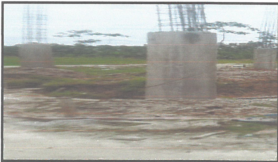
FOTO N°10: EN LA FOTO SE PUEDE OBSERVAR LAS COLUMNAS DESPUES DE RETIRAR EL ENCOFRADO