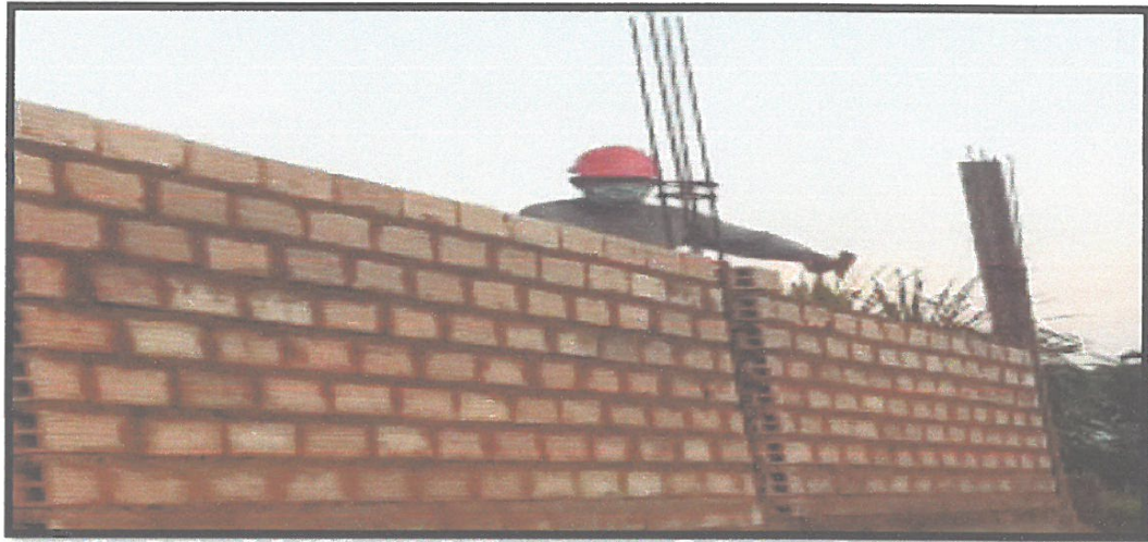
FOTO N°05: EN LA FOTO SE OBSERVA TRABAJOS DE MURO DE LADRILLO TUB (10.5*16.5*21.5) aparejo canto c:a 1:5 e=1.5cm.