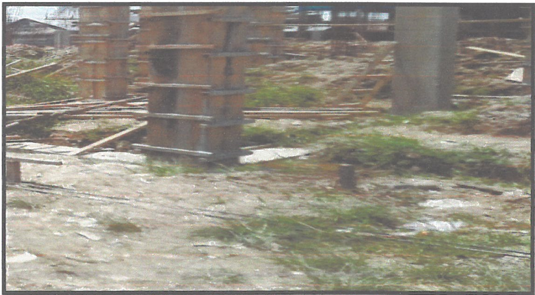
FOTO N°08: SE PUEDE OBSERVAR TRABAJOS DE ENCOFRADOS EN COLUMNAS DE LA I.E