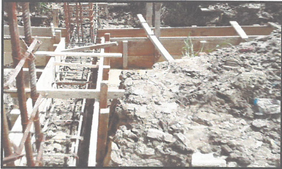
FOTO N°09: EN LA IMAGEN SUPERIOR SE PUEDE OBSERVAR TRABAJOS DE HABILITACION DE ACERO EN VIGAS DE CIMENTACION.