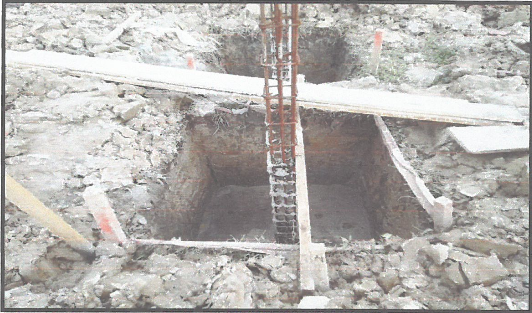
FOTO N°01: EN LA IMAGEN SE MUESTRA TRABAJOS DE MORTERO F'c= 210 KG/CM2 EN ZAPATAS