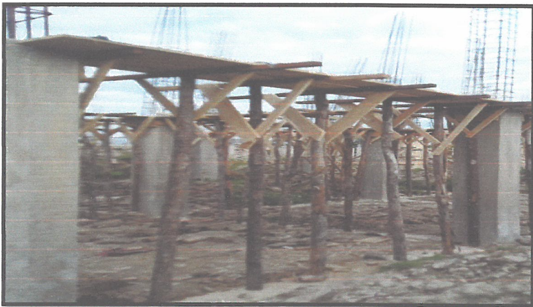
FOTO N°06: EN LA IMAGEN SUPERIOR SE OBSERVA TRABAJOS DE ENCOFRADOS DE VIGAS