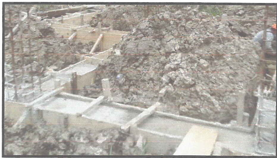
FOTO N°12: SE MUESTRA TRABAJOS DE ENCOFRADO PARA LA VIGA DE CIMENTACIÓN F'C=210 KG/CM2