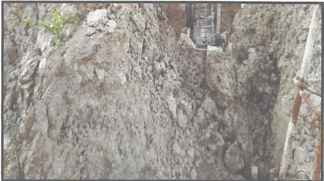
FOTO N°02: EN LA FOTO SE PUEDE OBSERVAR TRABAJOS DE EXCAVACIÓN DE ZANJAS PARA VIGAS DE CIMENTACIÓN