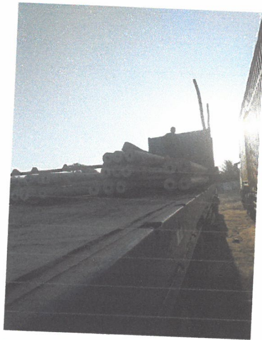
VISTA DE POSTES DE CAC DE 8 METROS EN LA EMBARCACION

KENYO ALBERTO MONTES CUELLAR INGENIERO CIVIL Reg. CIP N° 195722