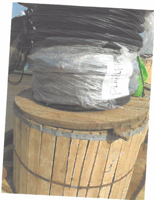
VISTA DE CARRETES DE CONDUCTORES EN SUS JABAS PROTECTORAS