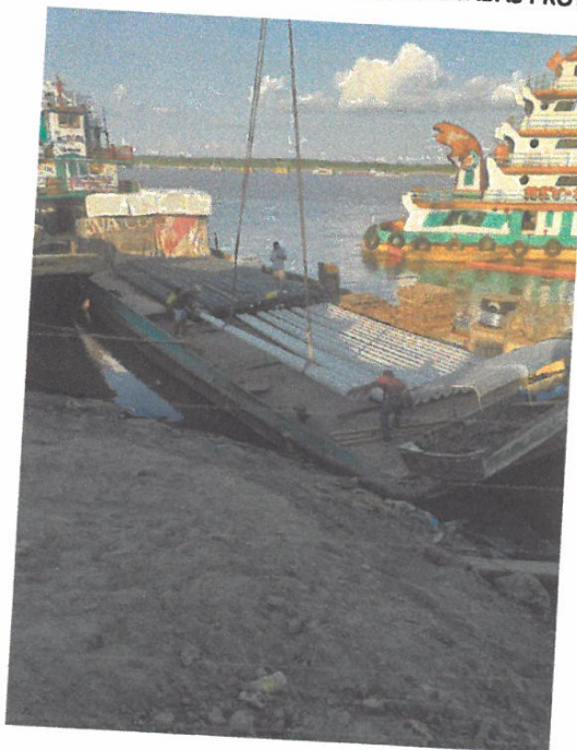
VISTA DE POSTE DE CAC DE 8 METROS EN LA EMBARCACION

[Handwritten Signature] KENYALBERTO MONTES CUELLAR INGENIERO CIVIL Reg. CIP N° 195722