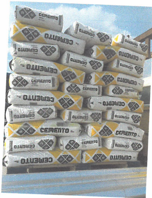
VISTA DE CEMENTO EN LA EMBARCACION