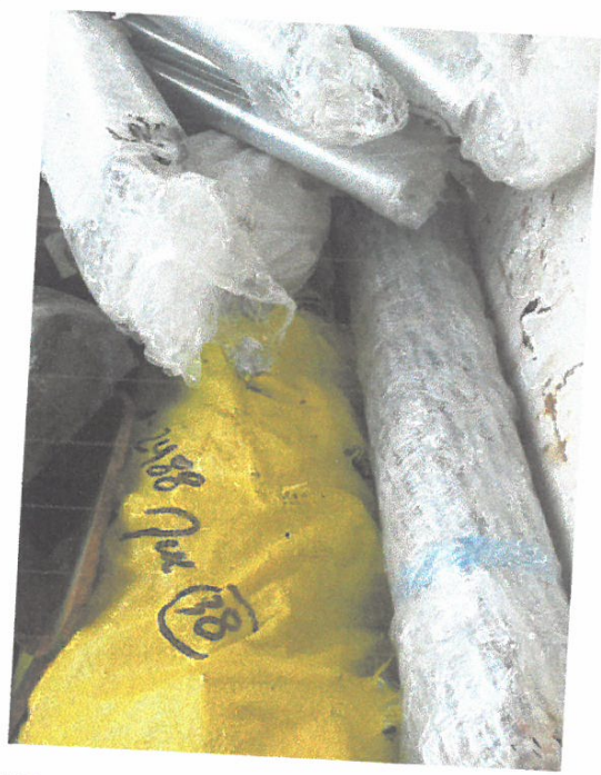
VISTA DE VARILAS PREFORMADAS PARA LAS RETENIDAS