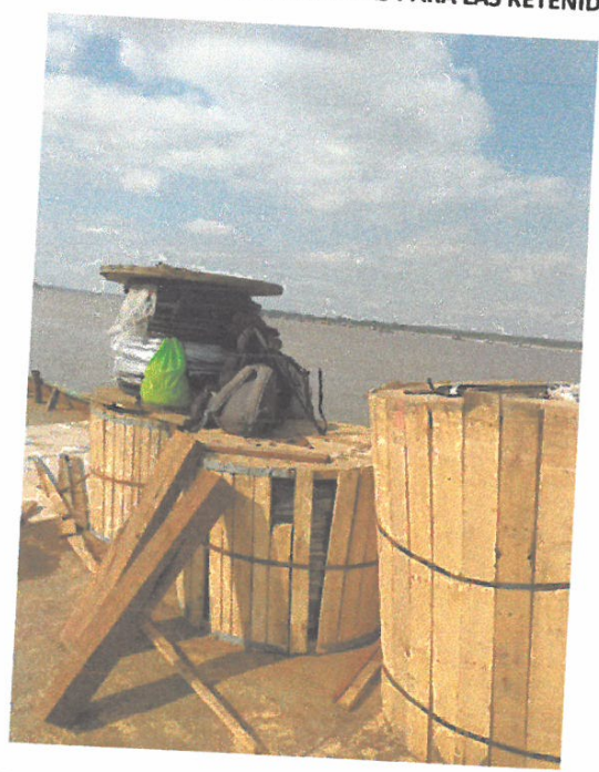
VISTA DE CARRETE DE CONDUCTORES CON SUS JABAS PROTECTORAS