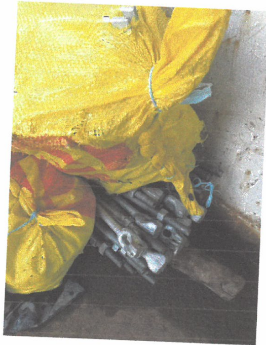
VISTA DE VARILAS DE ANCAJE DE RETENIDAS

KENYO ALBERTO MONTES CUELLAR INGENIERO CIVIL Reg. CIP N° 195722