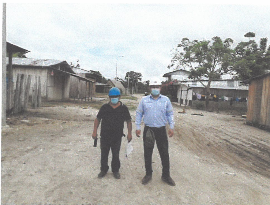
VISTA DEL RESIDENTE Y SUPERVISOR VERIFICANDO LA CANTIDADDE POSTES Y LUMINARIAS INSTLADAS EN LA OBRA