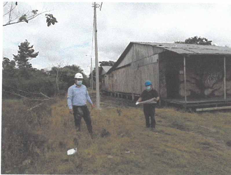
VISTA DE RESIDENTE Y SUPERVISOR VERIFICANDO LA UBICACIÓN DE LOS POSTES Y LAS MODIFICACION REALIZADAS EN EL REPLANTEO