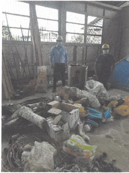
VISTA DE INSPECTOR EN EL ALMACEN DE LA OBRA