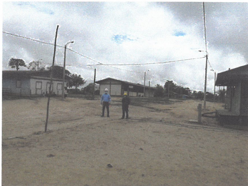
VISTA DE REDES SECUNDARIA CON EQUIPO DE ALUMBRADO PUBLICO.