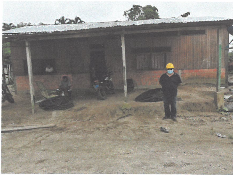
VISTA DEL RESIDENTE DE OBRA EN UNA VIVIENDA CON LOS MATERIAES DE REDES PRECARIAS RETIRADAS