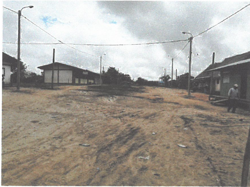
VISTA DE REDES SECUNDARIAS Y AUMBRADO EN TODOS LOS POSTES.