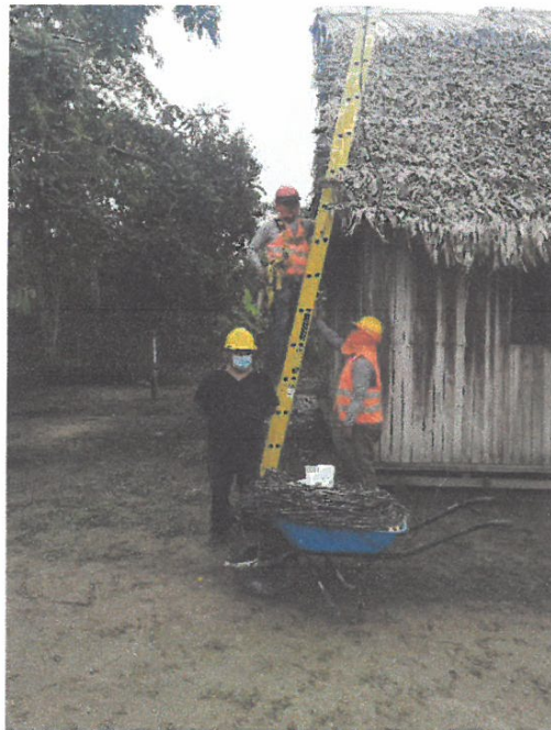
VISTA DE RESIDENTE CON PERSONAL REALIZANDO UNA CONEXIÓN DOMICILIARIA