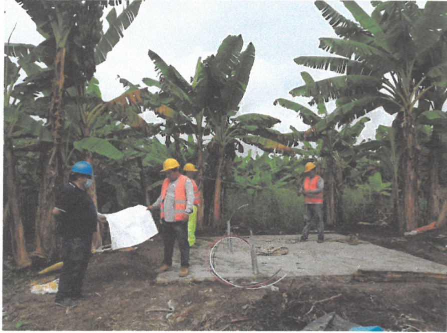
VISTA DE LOSA DE LA CASA DE FUERZA RESIDENTE CON MAESTRO DE OBRA