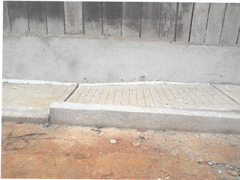
ACABADO DE SARDINEL EN LA CALLE CONDAMINE CUADRA 03, LADO IZQUIERDO