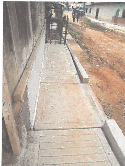
ACABADO DE RAMPA Y VEREDA EN LA CALLE CONDAMINE CUADRA 03 LADO IZQUIERDO.