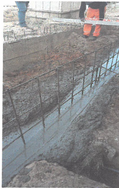
VACEO DE SARDINEL EN LA CALLE CONDAMINE CUADRA 03, LADO DERECHO.