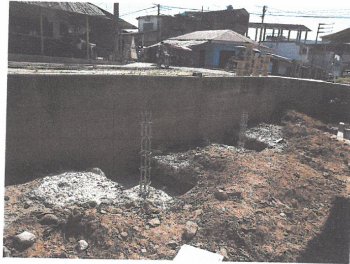
VACEO DE ZAPATA PARA RAMPA (ACCESO 01) EN LA CALLE TARATA 06 LADO DERECHO.