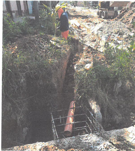
INSTALACION DE TUBERIA DE DESAGUE EN LA CALLE TARATA CUADRA 07, LADO IZQUIERDO.