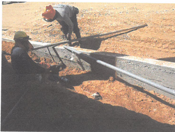
INSTALACION DE TUBERIA DE AGUA EN LA CALLE TARATA CUADRA 06, LADO IZQUIERDO.