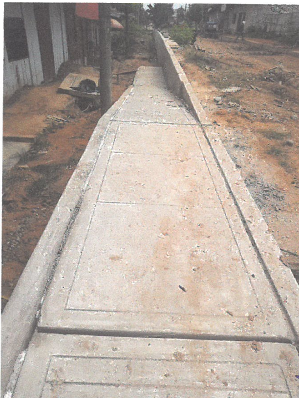
ACABADO DE VEREDA Y RAMPA EN LA CALLE CONDAMINE CUADRA 03, LADO DERECHO.