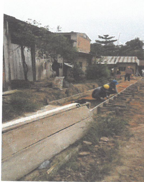
ENCOFRADO DE VEREDA EN LA CALLE TARATA CUADRA 07, LADO DERECHO