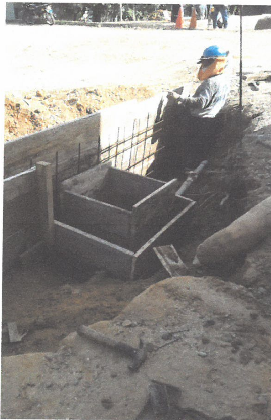
ENCOFRADO DE SARDINEL Y BUZON EN LA CALLE TARATA CUADRA 06, LADO IZQUIERDO.