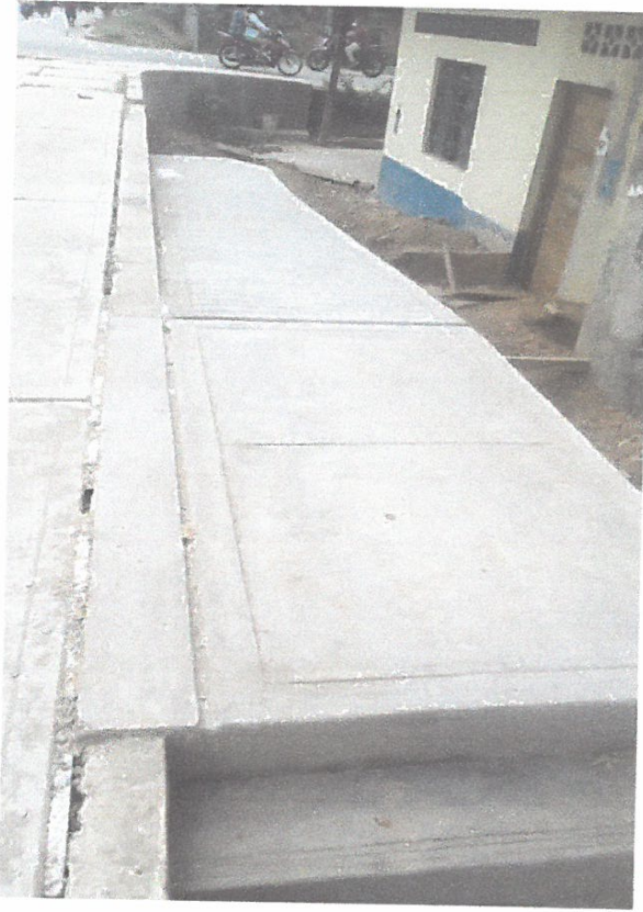
ACABADO DE RAMPA (ACCESO 01) EN LA CALLE TARATA CUADRA 06, LADO DERECHO.