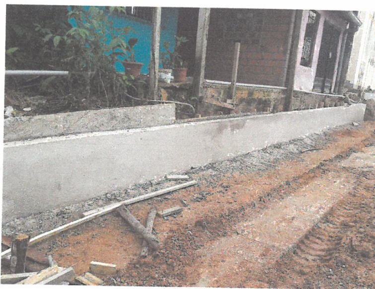
ACADO DE SARDINEL EN LA CALLE TARATA CUADRA 07, LADO IZQUIERDO.