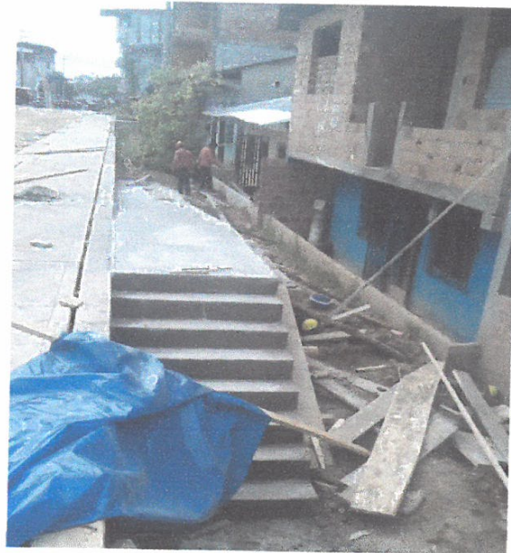
DESENCOFRADO DE RAMPA( ACCESO 02) EN LA CALLE TARATA CUADRA 06, LADO DERECHO.