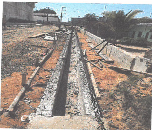
ENCOFRADO Y DEENCOFRADO DE LATERALES DE CUNETA EN LA CALLE TARATA CUADRA 07, LADO DERECHO.