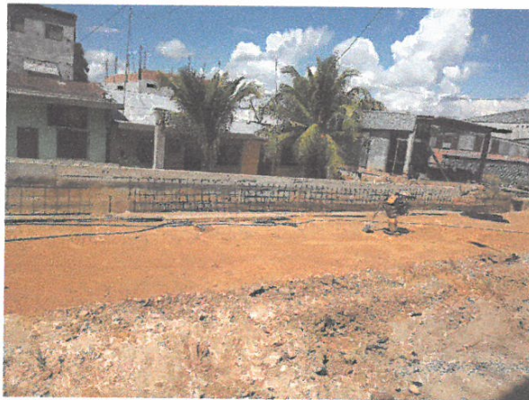
ENCOFRADO DE PISO DE CUNETA EN LA CALLE TARATA CUADRA 07, LADO DERECHO