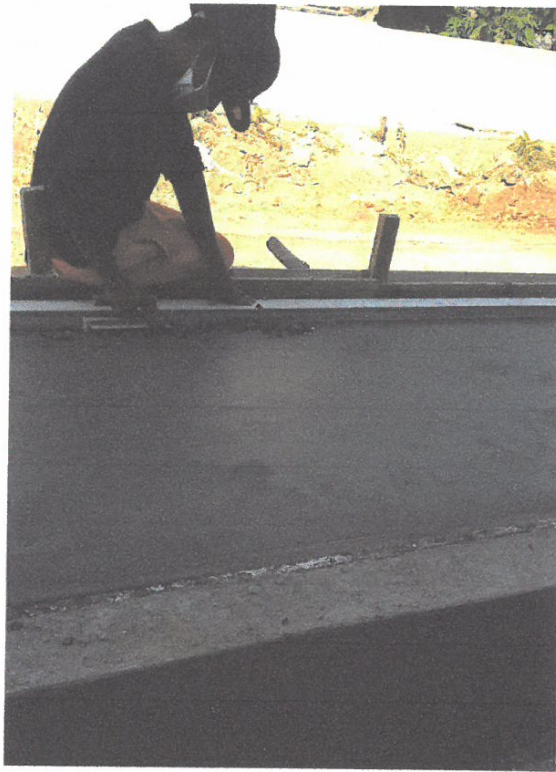
BRUÑADO Y ACABADO DE VEREDA EN LA CALLE CONDAMINE CUADRA 03, LADO DERECHO.