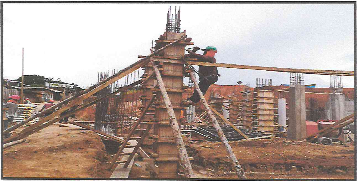
IMAGEN 09: OPERARIO USANDO CORRECTAMENTE EL ARNES EN ENCOFRADO DE COLUMNAS