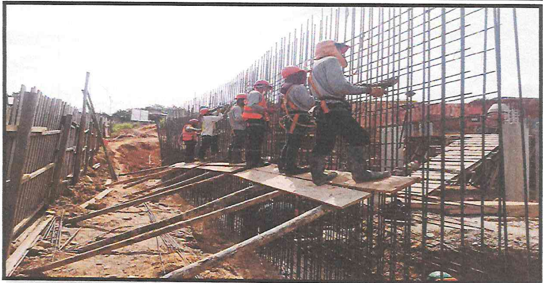
IMAGEN 10: COLABORADORES CON ARNES EN ACTIVIDAD DE ENMALLADO