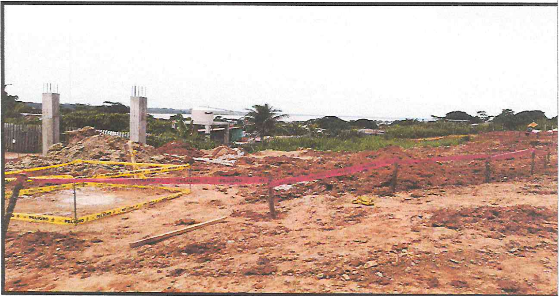
IMAGEN 05: SEÑALIZACION EN ZONA DE ALTO RIESGO