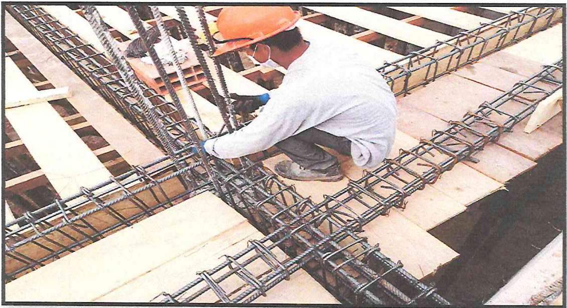
IMAGEN 07: COLABORADOR CON EPP COMPLETO EN ACTIVIDAD DE FIERRERIA