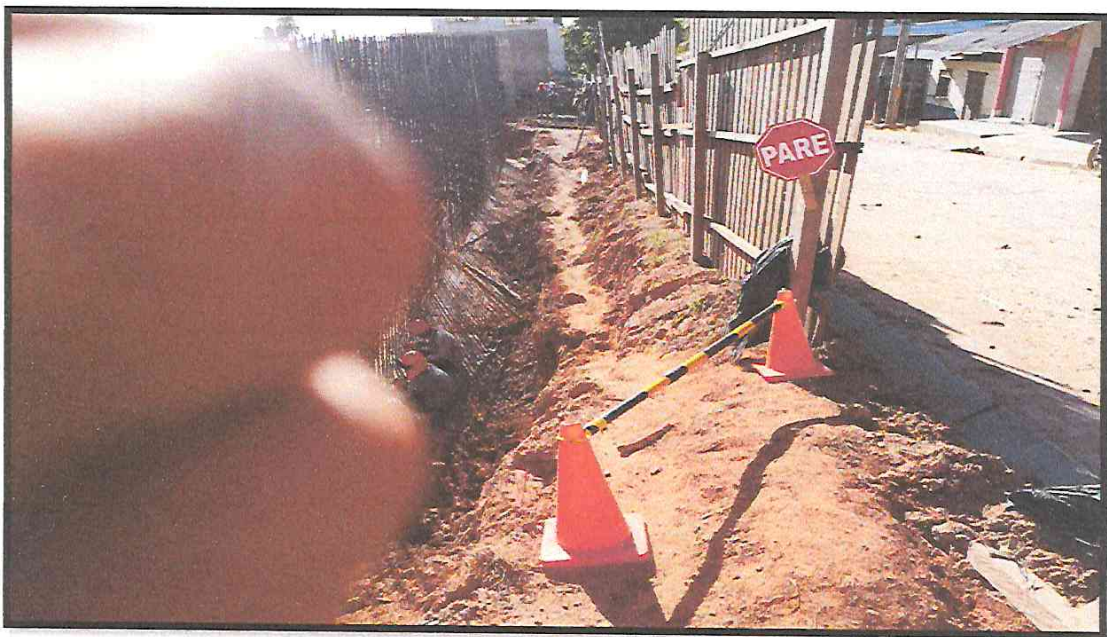
IMAGEN 04: SEÑALIZACION CON CONOS EN ZONA DE ALTO RIESGO