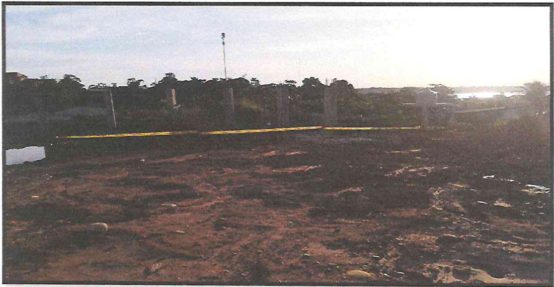
IMAGEN 03: SEÑALIZACION CON CINTA DE SEGURIDAD EN ZONAS DE EXCAVACION