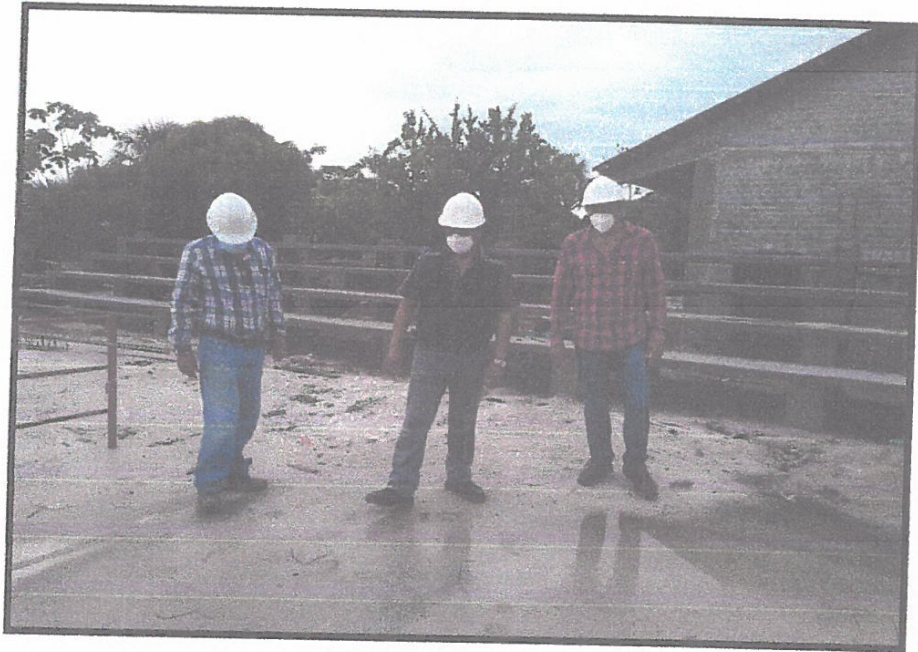
FOTO N°07: Supervisor verificando trabajos realizados en losa deportiva.