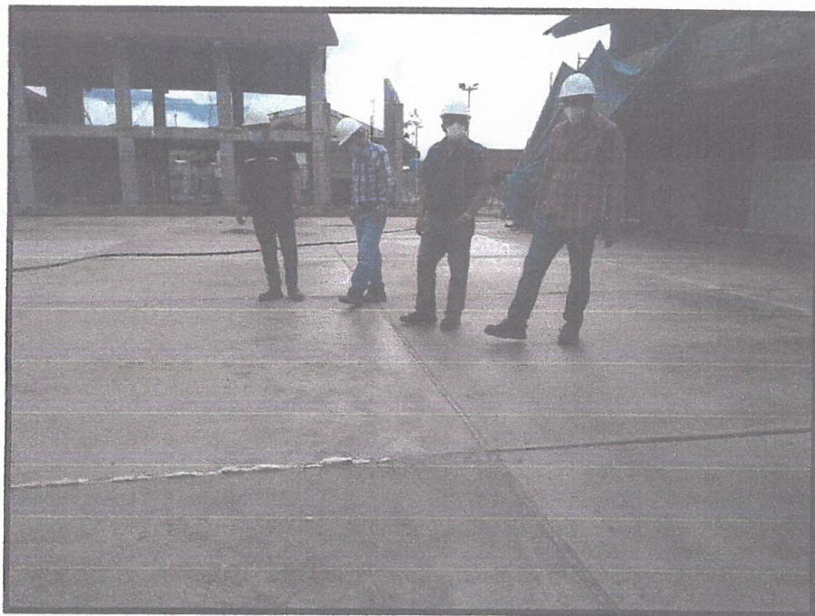
FOTO N°10: Verificando trabajos realizados en patio de formación.