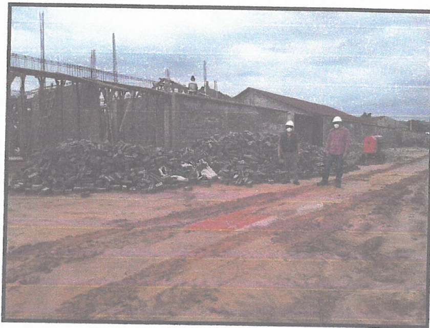
FOTO N°06: Supervisor de obra verificando los trabajos ejecutados en obra acompañado del residente.